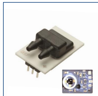
Силиконовые емкостные датчики давления