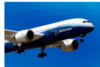
Аэрокосмос и оборона