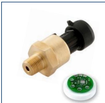
Керамические емкостные датчики давления