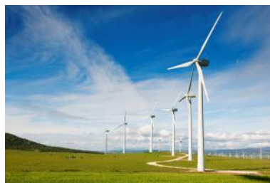
Энергетика и Инфраструктура