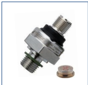
Тонкопленочные датчики давления