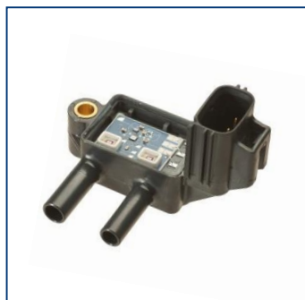
Пьезорезистивные датчики давления