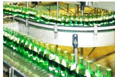
Питание и напитки