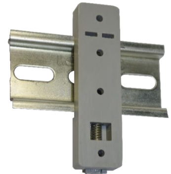
Рисунок 1. Commeng DR MH

Может поставляться как отдельное изделие другим производителям электротехнического оборудования.