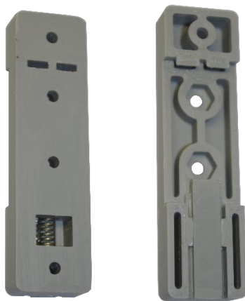
Рисунок 2. Внешний вид монтажного основания

Внешний вид защелки в сборе показан на рисунке 2, габаритные размеры на рисунке 3, основные технические характеристики приведены в таблице 1.